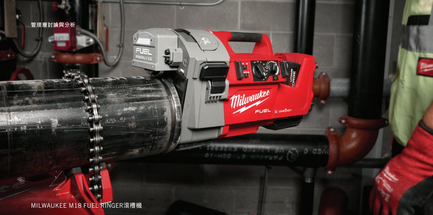
MILWAUKEE M18 FUEL RINGER滾槽機