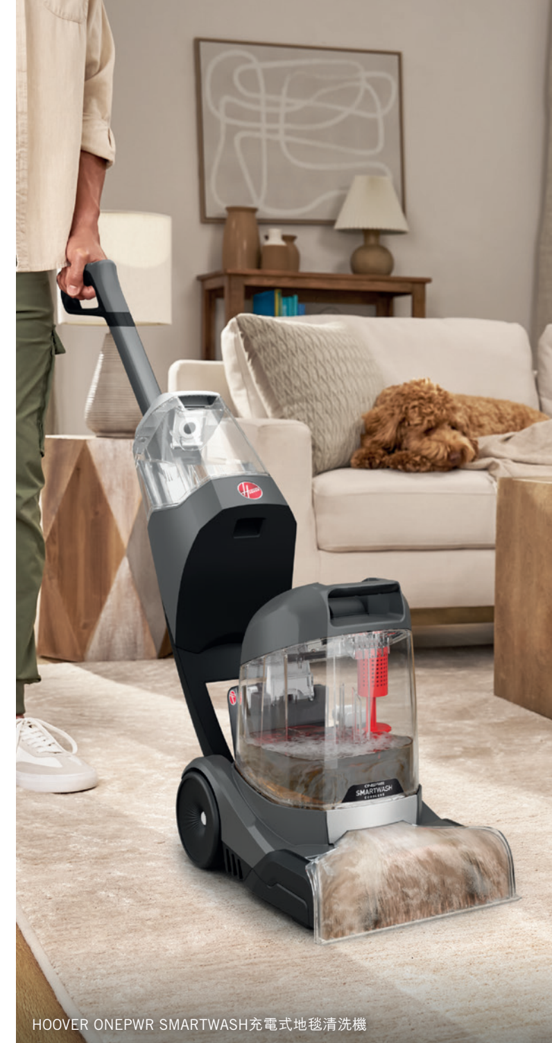
HOOVER ONEPWR SMARTWASH 充電式地毯清洗機