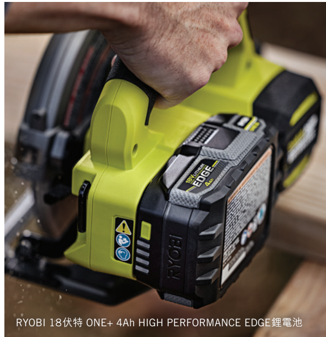
RYOBI 18伏特 ONE+ 4Ah HIGH PERFORMANCE EDGE 鋰電池