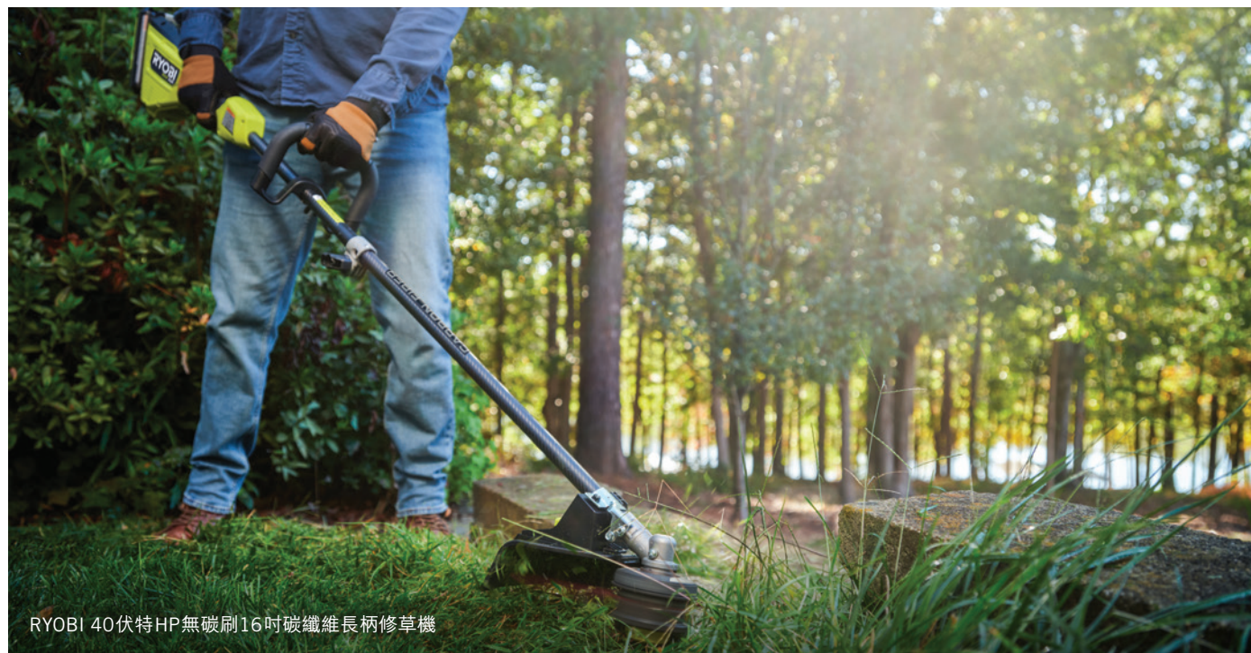
RYOBI 40伏特HP無碳刷16吋碳纖維長柄修草機

我們的策略是吸引新用戶加入我們的充電式電池平台，同時為現有的用戶群增加新產品，進一步擴展我們的平台。自一九九六年推出以來，RYOBI 18伏特ONE+平台至今已提供超過314款兼容產品。我們強大的RYOBI 40伏特系統現有90款產品，而RYOBI USB LITHIUM系統則為用戶提供26款輕巧、便攜的解決方案。