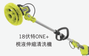
18伏特ONE+ 視液伸縮清洗機