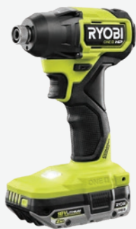
第二代18伏特ONE+ HP輕型 無碳刷1/4吋六角頭衝擊起子機