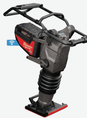
MX FUEL 70kg夯土機