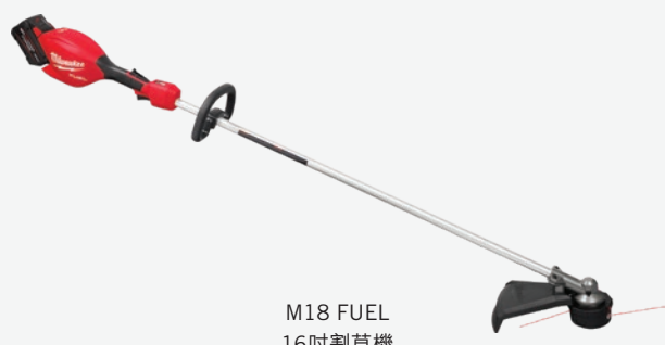
M18 FUEL 16吋割草機