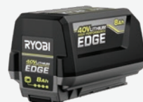
40伏特8Ah Lithium HP Edge電池