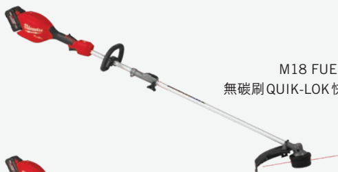
M18 FUEL 無碳刷 QUIK-LOK 快鎖割草機