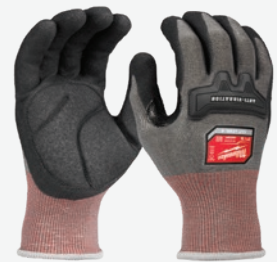
高靈活度4級防割 浸膠處理防震手套