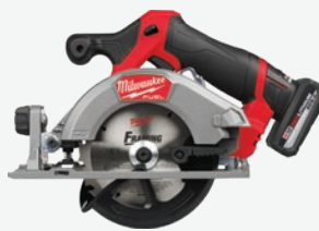
M12 FUEL 無碳刷5-3/8吋圓鋸機