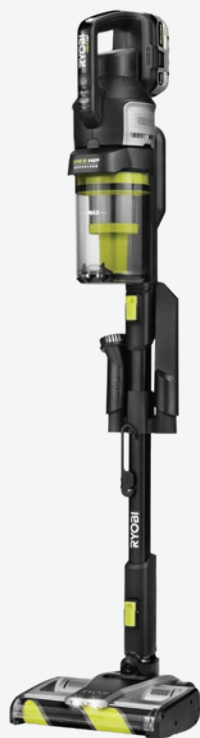
18伏特ONE+ HP 先進長柄吸塵機