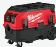
M18 FUEL 無碳刷PACKOUT 雙電池9加侖吸塵機