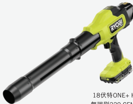
18伏特ONE+ HP輕型 無碳刷220 CFM吹風機