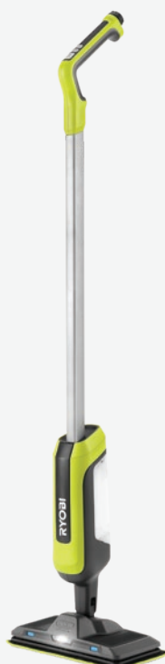
USB Lithium 電動噴水拖把