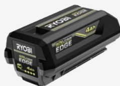
40伏特4Ah Lithium HP Edge電池