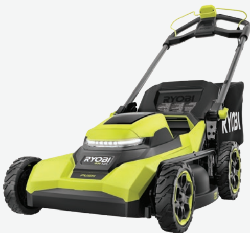
40伏特HP無碳刷 21吋手推式剪草機