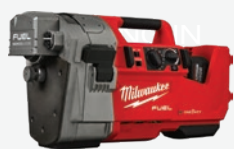
M18 FUEL 無碳刷RINGER滾槽機