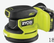
18伏特ONE+ HP無碳刷 5吋隨機軌道砂磨機