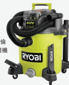
40伏特10加倫 乾濕兩用吸塵機