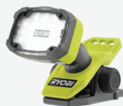
USB Lithium LED磁力夾燈