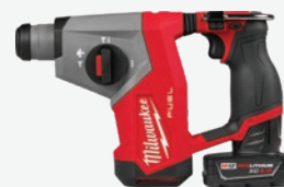
M12 FUEL 無碳刷5/8吋SDS Plus四坑錘鑽