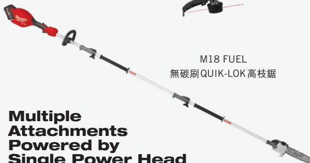
M18 FUEL 無碳刷 QUIK-LOK 高枝鋸

Multiple Attachments Powered by Single Power Head