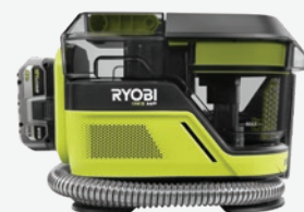
18伏特ONE+ HP SWIFTCLEAN 中型去污清洗機