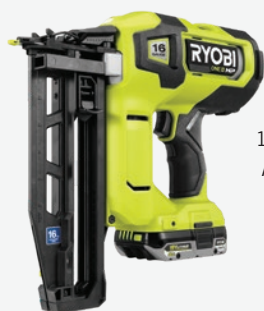
18伏特ONE+ HP無碳刷 AIRSTRIKE 16GA釘槍