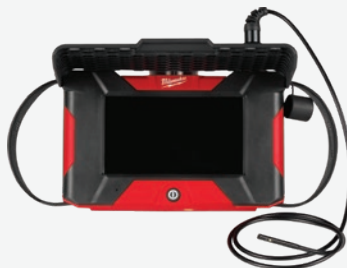
M12汽車內視鏡 內建Wi-Fi檔案傳輸功能