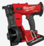
M18 FUEL 無碳刷捲釘槍