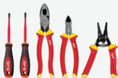
1000V 絕緣 手動工具套裝(5支裝)