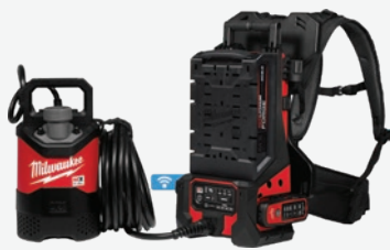
MX FUEL 1HP 2吋潛水泵