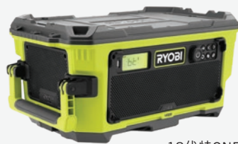
18伏特ONE+ HYBRID VERSE LINK 藍牙音響