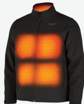
M12 TOUGHShell 發熱夾克