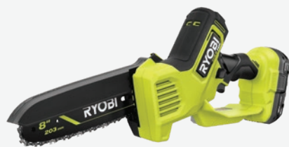
18伏特ONE+ HP輕型 無碳刷8吋樹枝鏈鋸