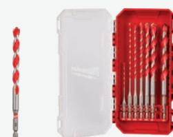
SHOCKWAVE Impact Duty 合金鎚鑽咀