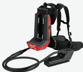
MX FUEL 便攜式外置電池