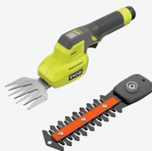
USB Lithium 灌木剪