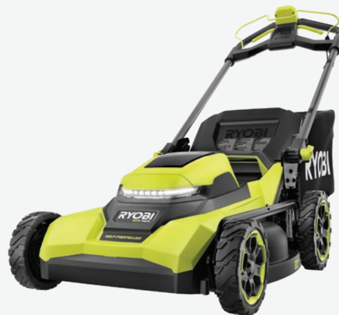
40伏特HP無碳刷 21吋自動推進式剪草機