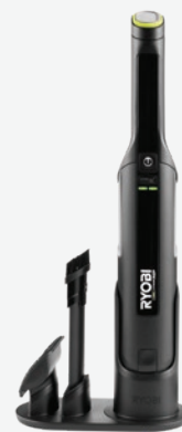
USB Lithium HP輕型手提吸塵機