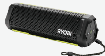
USB Lithium VERSE輕型喇叭