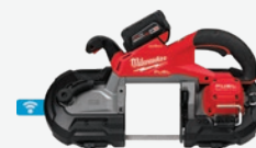
M18 FUEL 雙開關大開口帶鋸機