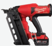
M18 FUEL 無碳刷雙頭釘槍