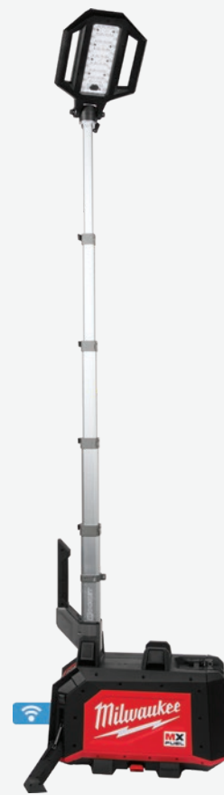
MX FUEL ROCKET小型塔燈