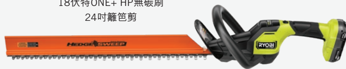
18伏特ONE+ HP無碳刷 24吋籬笆剪