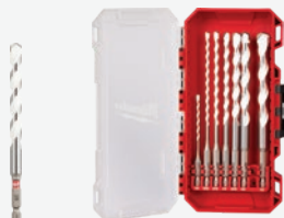
SHOCKWAVE Impact Duty 複合材料鑽咀