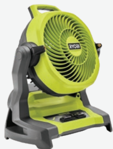
18伏特ONE+ 7.5吋桶頂噴霧風扇