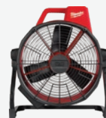
M18無碳刷 高效能風扇