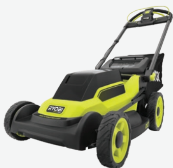
18伏特ONE+ HP無碳刷 20吋自動推進式剪草機