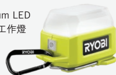
USB Lithium LED 輕型區域工作燈