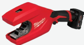
M12無碳刷1-1/4吋 - 2吋 銅管切刀