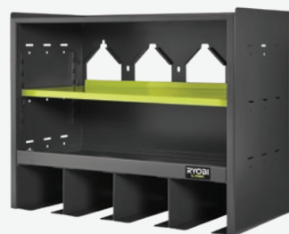
LINK開放式工具收納櫃