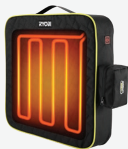
USB Lithium 加熱座墊