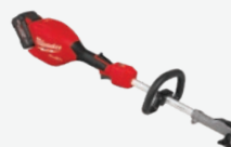
M18 FUEL 無碳刷 QUIK-LOK 快鎖多功能 園林工具動力頭