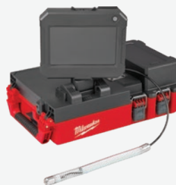
M12 PACKOUT 75呎排水管攝影機