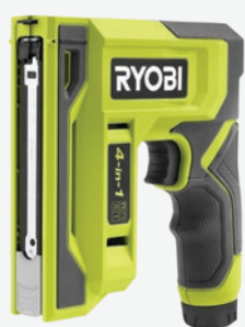
USB Lithium 四合一釘槍