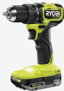
第二代18伏特ONE+ HP輕型 無碳刷1/2吋電鑽