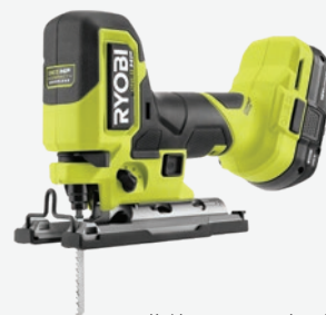
18伏特ONE+ HP輕型 無碳刷桶形手把線鋸