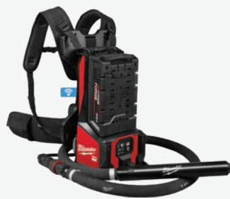
MX FUEL 背負式高頻率混凝土振動器