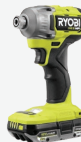
第二代18伏特ONE+ HP無碳刷 四種模式1/4吋六角頭衝擊起子機