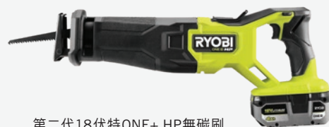
第二代18伏特ONE+ HP無碳刷 往復鋸