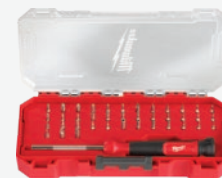
39合1 精巧螺絲批套組