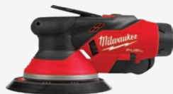
M12 FUEL 無碳刷6吋隨機軌道砂紙機