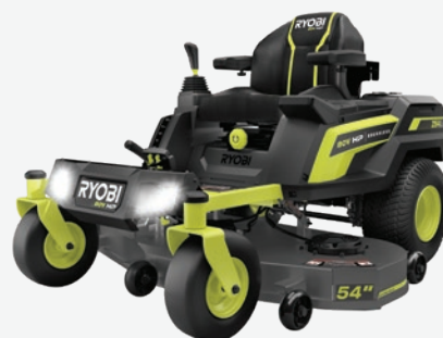
80伏特HP無碳刷 54吋Lithium電動草坪拖拉機