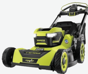
40伏特HP無碳刷 21吋自動推進式AWD多重刀片剪草機