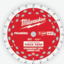
7-1/4吋24T 圓鋸機厚齒鋸片