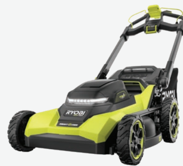
40伏特HP無碳刷 21吋自動推進式多重刀片剪草機