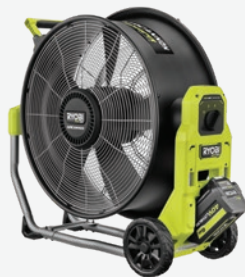
40伏特HP無碳刷混能20吋鼓式風扇