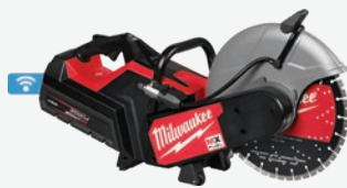
MX FUEL 14吋速停切割鋸