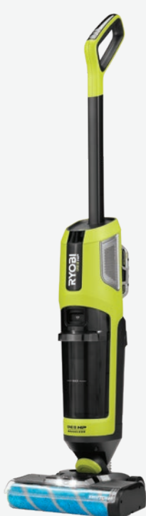
18伏特ONE+ HP SWIFTCLEAN 乾濕兩用長柄吸塵機