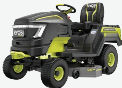
80伏特HP無碳刷 46吋Lithium電動駕駛式剪草機