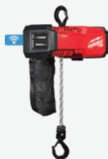
M18小型 1噸鏈式起重機