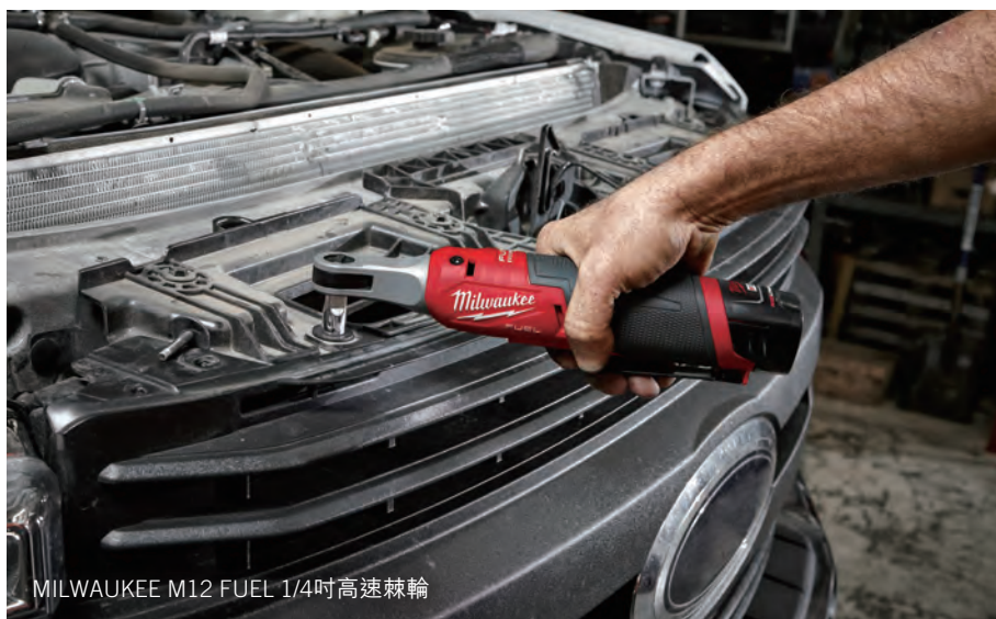
MILWAUKEE M12 FUEL 1/4吋高速棘輪

此外，我們還推出一系列創新工具，進一步擴充MILWAUKEE M12輕型充電式設備平台。重點產品之一是M12 FUEL高速衝擊棘輪，方便用家提升生產力，其銷售額亦遠超預期。