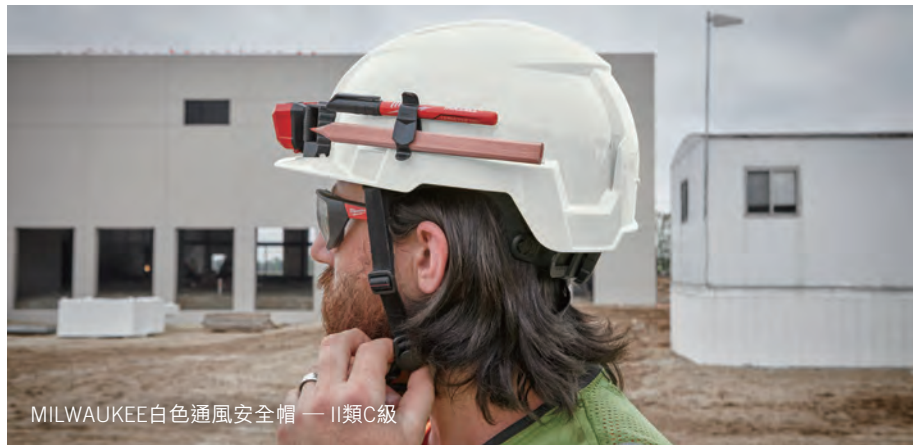
MILWAUKEE 白色通風安全帽 — II類C級

當我們留意到改良市面上現存個人安全裝備(PPE)市場尚有重大機遇，便成立了專注發展創新產品的團隊。我們現時已推出超過六百款個人安全裝備產品，全部均為用戶提升保護、舒適度、安全性及生產力而設。我們個人安全裝備最新的旗艦系列涉足無處不在的安全帽領域。MILWAUKEE安全帽系列為用戶創造一個更安全、更舒適、更高效的環境。