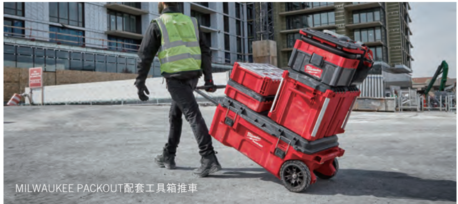
MILWAUKEE PACKOUT 配套工具箱推車

此外，我們繼續擴展革命性的MILWAUKEE PACKOUT儲存系統，以滿足專業用戶不斷增長的儲存、運輸和組織需求。隨著最近推出的PACKOUT特深收納箱、工地工具箱推車及特大工具箱，這個創新系統現在合共有四十五種可以配搭使用的產品。