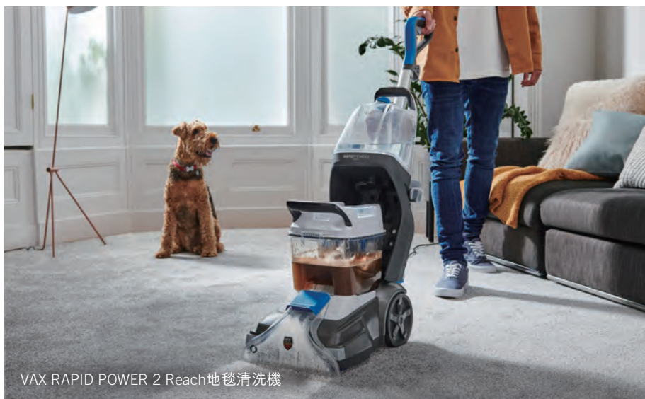
VAX RAPID POWER 2 Reach 地毯清洗機