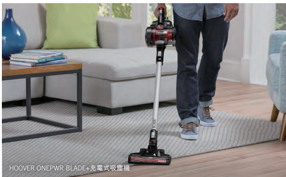
HOOVER ONEPWR BLADE+ 充電式吸塵機