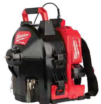
M18 FUEL SWITCH PACK 組合式輸送滾筒系統