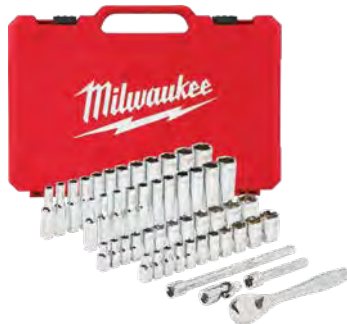
棘輪扳手及套筒組合