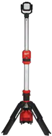
M12 ROCKET 雙電源塔燈

MILWAUKEE工地照明系列乃業界首套高輸出LED照明系統，提供操作時間高達一整天的便攜式照明工具，全部工地電燈採用最先進的照明技術，確保能帶來穩定的光線、最佳的色溫、逼真的顏色及細節，提升工作環境的生產力。此工地電燈特別為配合、提升、應付專業用家日常工作需要而設，照明效果更強勁、操作更持久。