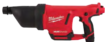
M12 AIRSNAKE 渠道噴氣清潔槍