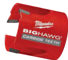
碳化合金鋸齒的2-9/16" BIG HAWG 圓孔鋸頭