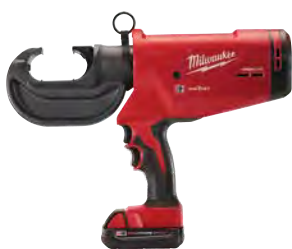
M18 FORCE LOGIC 750 MCM 高強度壓接器