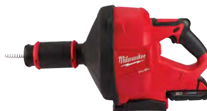
M18 FUEL下水道疏通器 連纜繩上鎖系統