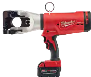
M18 FORCE LOGIC 1590 ACSR 高強度切割器