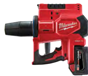
M18 FORCE LOGIC 2"-3" PROPEX 接駁工具